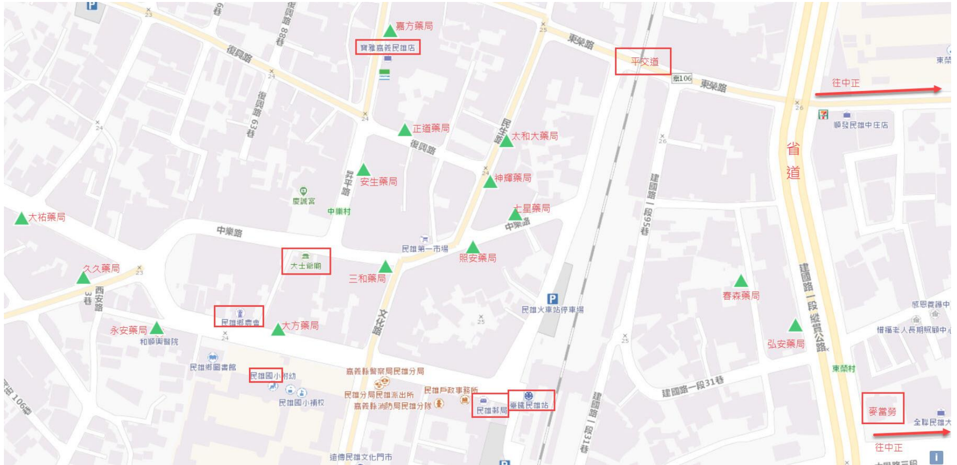
圖 05. 簡列民雄市區內藥局分布