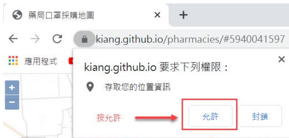
圖 03. 藥局口罩採購地圖網站定位存取要求

第一次進入此網頁，會出現小視窗要求存取您的位置資訊，記得按允許後，進入會出現民雄市區所在區域附近的藥局清冊。